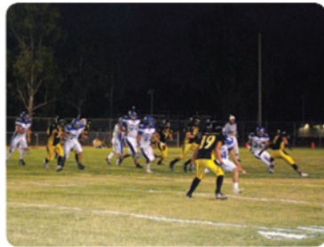
Los Zorros midieron sus fuerzas ante los Borregos del ITESM.

🔥 Se enfrentan Zorros del CETYS contra Borregos del ITESM. - El 2do. encuentro de fútbol americano, categoría Varsity entre los Zorros de CETYS Universidad y los Borregos del Instituto Tecnológico y de Estudios Superiores de Monterrey (ITESM), campus Monterrey, se realizó el jueves 28 de agosto en el Estadio de los Zorros, campus Mexicali, con una asistencia de más de mil seguidores. Tras un arduo combate, el equipo visitante logró la victoria con un marcador final de 48-0.