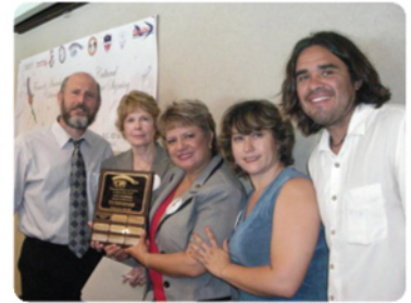
CETYS en convenio con Sister Schools de San Diego.

Firman convenio con Sister Schools.- CETYS Universidad firmó un convenio de colaboración con la organización no gubernamental Sister Schools of San Diego, el cual permitirá trabajar en conjunto al Bachillerato Internacional (BI) del CETYS con High Tech High International. Desde 2004 el bachillerato ha participado en diversas actividades con la organización y construido una relación cada vez más sólida con High Tech High Internacional (HTHI) en una diversidad de proyectos.