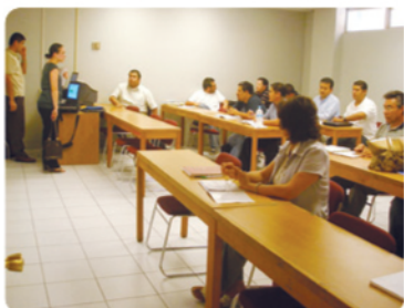
El segundo grupo inició clases.

🔥 Primer grupo de Carreras Gerenciales inició clases.- La Licenciatura en Administración de Negocios (LAN), primera Carrera Gerencial que CETYS Universidad ofrece en la modalidad mixta de estudio, inició actividades el 14 de julio, con un grupo conformado por 19 estudiantes mayores de 24 años de edad.