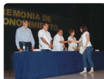
Entrega de Reconocimientos de Alto Rendimiento en Educación Superior.

🔥 CETYS reconoce a alumnos sobresalientes.- Un total de 55 alumnos del área de profesional de CETYS Universidad, fueron distinguidos por haber obtenido un promedio final de 98 a 100 durante el semestre pasado, en la Ceremonia de Reconocimiento al Alto Rendimiento en Educación Superior.