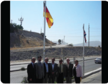
Inauguración del acceso principal a CETYS por el bulevar Manuel J. Clouthier.

Inauguran banderas en acceso a CETYS.- Simbólicamente los cónsules honorarios de Japón, Israel y Alemania izaron las banderas de los países que representan para coadyuvar el esfuerzo conjunto de CETYS Universidad en materia de internacionalización, ello como parte de la inauguración del acceso principal a CETYS por el bulevar Manuel J. Clouthier.