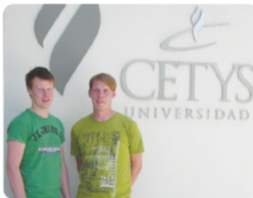
Alumnos de Intercambio provenientes de Finlandia.