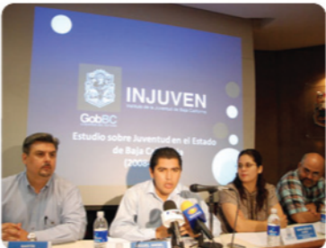
Los resultados de esta investigación ayudarán al programa especial de jóvenes 2009-2013.

CETYS e INJUVEN realizarán estudio de la juventud.- CETYS Universidad y el Instituto de la Juventud de Baja California (INJUVEN), realizarán en conjunto el "Estudio de la Juventud del Estado 2008-2009", que tiene como finalidad desarrollar un análisis de la situación histórica, actual y la perspectiva de la juventud en el Estado, ya que se busca contextualizar la tendencia social que tienen los jóvenes de entre 12 a 29 años de edad, por medio de la aplicación de encuestas y entrevistas.