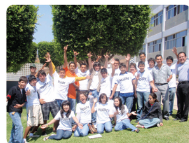
Participantes del Programa de Movilidad Estudiantil.

Finalizó el Programa de Movilidad Estudiantil.- Se llevó a cabo la entrega de reconocimientos a los 22 alumnos que finalizaron el Programa de Movilidad "Echa a volar tu imaginación" organizado en coordinación por la Preparatoria CETYS y el Colegio de Ingeniería del campus Ensenada. Los alumnos asistieron a talleres y conferencias donde pudieron conocer lo que son las ingenierías de forma práctica, utilizando las matemáticas de una manera divertida y conociendo cuál es su verdadera vocación.