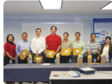
Participantes del 1er. Foro de Egresados.

Primer Foro de Egresados.- En la sala audiovisual A del Edificio de Profesional de CETYS Universidad campus Ensenada, se realizó el Foro de Egresados en donde asistieron alumnos de primer semestre de las carreras de Ingeniería Cibernética, Mecánica, Mecatrónica, Industrial y Software. 6 egresados representativos de diferentes generaciones, hablaron sobre sus experiencias laborales y sobre todo las oportunidades que han tenido al ser egresados de CETYS.