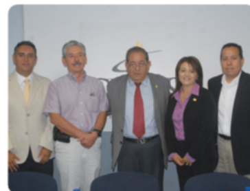
Nueva generación de Consejeros.