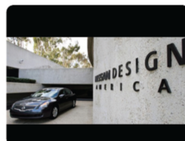
En busca de alianzas, CETYS se reúne con Nissan.

🔥 Tiene CETYS acercamiento con el Centro de Diseño Nissan.- Un total de 13 directivos y profesores de CETYS Universidad visitaron el Centro de Diseño de la Nissan (Nissan Design America - NDA) ubicado en La Joya, California, para conocer las instalaciones y procesos de trabajo de esta reconocida firma, ya que actualmente ambos organismos se encuentran en pláticas de proyectos comunes.