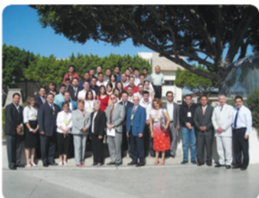
Egresados de IDE en curso de actualización.