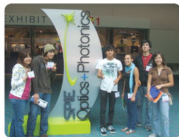
Se presentó lo más reciente en ingeniería óptica.

Alumnos asistieron al Congreso Internacional.- El congreso Optics and Photonics, se llevó a cabo en San Diego, California, donde asistieron alumnos de CETYS Universidad. Dicha convención busca el acercamiento a la ciencia y la aplicación de la luz, donde expositores de todo el mundo presentan lo más reciente en ingeniería óptica, instrumentación astronómica, sensores, procesadores de imagen y señales, tecnología óptica de rayos X, entre otros.