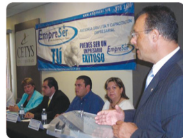
EmpreSer en apoyo con CETYS para beneficio de sus estudiantes.

Firman convenio CETYS- EmpreSer.- CETYS Universidad fue sede de la entrega de reconocimientos a cinco nuevas empresas que recibieron asesoría por parte de EmpreSer, además se firmó el convenio de colaboración entre CETYS y EmpreSer, para que los estudiantes puedan realizar su servicio profesional y prácticas en dicha institución. EmpreSer brinda asesoría y capacitación gratuita para crear empresarios socialmente responsables.