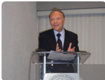
Gertz Manero, Rector de la Universidad de las Américas y Presidente de FIMPES.

🔥 Visita Gertz Manero a CETYS.- Gertz Manero, quien actualmente se desempeña como Rector de la Universidad de las Américas y Presidente de FIMPES, (Federación de Instituciones Mexicanas Particulares de Educación Superior), organismo que acreditó a CETYS por su calidad académica, impartió en CETYS Universidad la conferencia "El futuro de la educación superior particular en México", ello en el marco de la preparación del Plan 2020.