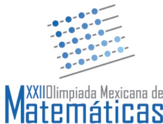
Seleccionados para participar en Olimpiada de Matemáticas.