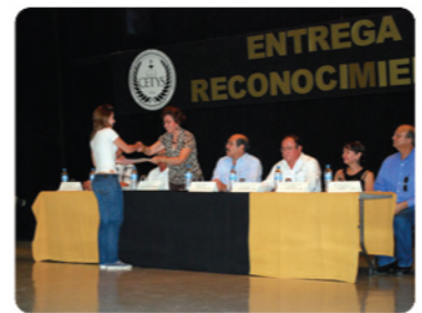
Parte del alumnado de Preparatoria, fue reconocido por sus logros.

🔥 52 alumnos de Preparatoria CETYS son reconocidos. - El 27 de agosto, se realizó la entrega de reconocimientos en el Auditorio de CETYS Universidad a 52 alumnos de esta institución, quienes destacaron por su desempeño en el ámbito académico y deportivo durante el semestre pasado.