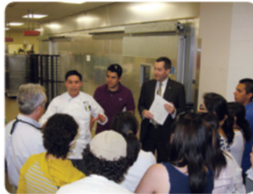
Los 14 estudiantes del CETYS campus Mexicali y los 4 de Tijuana, estuvieron en Seattle.