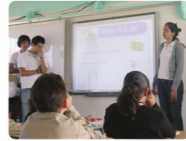
Alumnos presentando ante alumnos de la Escuela Secundaria Diurna No. 2.