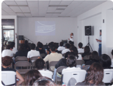
Alumnos en plática sobre emprendedurismo.