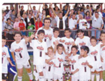
Pachuca, campeón la Liga Menor Urbana de Fútbol de Mexicali.

🔥 ¡CETYS Pachuca Campeón!.- Con un marcador a favor de 5-1, CETYS Pachuca resultó campeón en la Categoría Estrellita de la Liga Menor Urbana de Fútbol de Mexicali. El adversario fue el equipo de España y la competencia se desarrolló en las inmediaciones del campo Anexo Necaxa de la Colonia Nueva, a principios de julio.