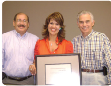
7 alumnos de reingreso de Ingeniería se hicieron merecedores a recibir un apoyo del 80%.

Estudiantes reciben Beca Accuride del 80%.- Se llevó a cabo la ceremonia de entrega de becas Accuride en la sala de juntas de la compañía establecida en Mexicali, donde 7 alumnos de reingreso de las carreras de Ingeniería Industrial y Mecatrónica de CETYS Universidad, campus Mexicali, se hicieron merecedores a recibir un apoyo del 80% para continuar con sus estudios.