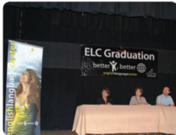
La ceremonia estuvo a cargo de coordinadores y docentes del Centro de Idiomas.