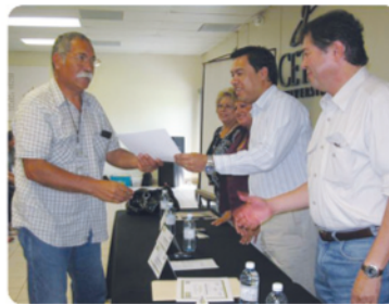
Egresados de Diplomados en CETYS.