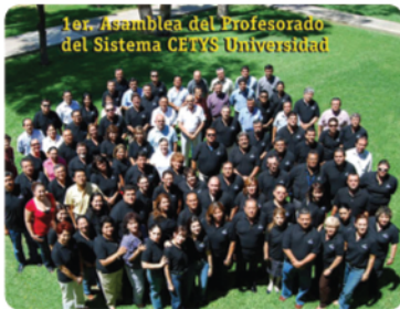
1er. Asamblea del Profesorado del Sistema CETYS Universidad