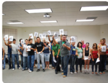
Los 38 alumnos foráneos recibieron el Programa de inducción.

CETYS recibe a 38 alumnos foráneos.- El Centro de Desarrollo Estudiantil (CEDE), la Mesa Directiva de la Sociedad de Alumnos Foráneos (SAFO) y el Departamento de Promoción de CETYS Universidad, campus Mexicali, organizaron el Programa de Inducción de Alumnos Foráneos el día 20 de agosto en la Sala Kenworth. Este evento fue dirigido a 38 alumnos foráneos de nuevo ingreso de los programas de Ingeniería, Administración y Negocios, Derecho y Psicología.