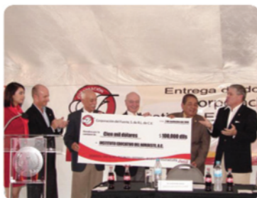
Entrega de Donativo por parte de Corporación Del Fuerte.

Entrega Donativo Corporación Del Fuerte.- Corporación Del Fuerte entregó a CETYS Universidad la primera parte de un donativo de 300 mil dólares, que será destinado para la construcción del Auditorio "Corporación del Fuerte" dentro del Edificio de Posgrado "José Fimbres Moreno". Esta aportación va direccionada al Auditorio con una capacidad para 120 personas del edificio de Posgrado, que está destinado para reforzar los programas de Posgrado y Educación Continua.