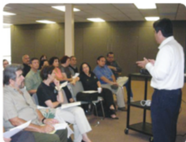
Maestros de Ciencias Sociales y Humanidades en reunión.

🔥 Reúnen a Maestros de Ciencias Sociales y Humanidades.- Maestros de planta, asociados y de asignatura del Departamento de Humanidades y Ciencias Sociales de los tres campus fueron convocados a una reunión en la cual se dio a conocer el panorama académico actual de CETYS Universidad. Entre los objetivos destacan dialogar en torno a la experiencia del trabajo con sus materias y acordar las modificaciones que consideren pertinentes, así como generar una instancia de comunicación que contribuya en la evaluación sistemática de las materias.