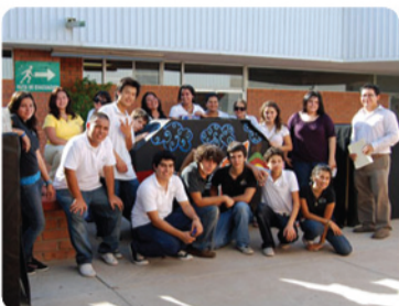
El ejercicio consistió en la construcción de una cámara oscura de gran formato.